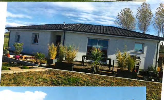
Maisons de la Côte Atlantique